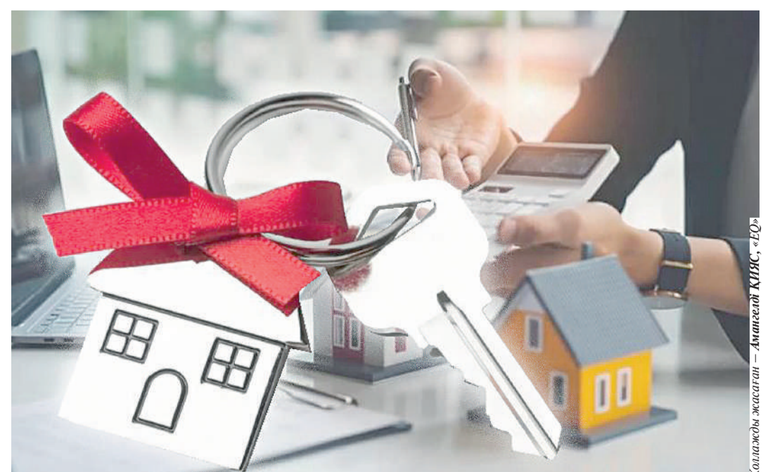
Қолжазбы жасаған – Аманжол ҚИЯС, «EQ»