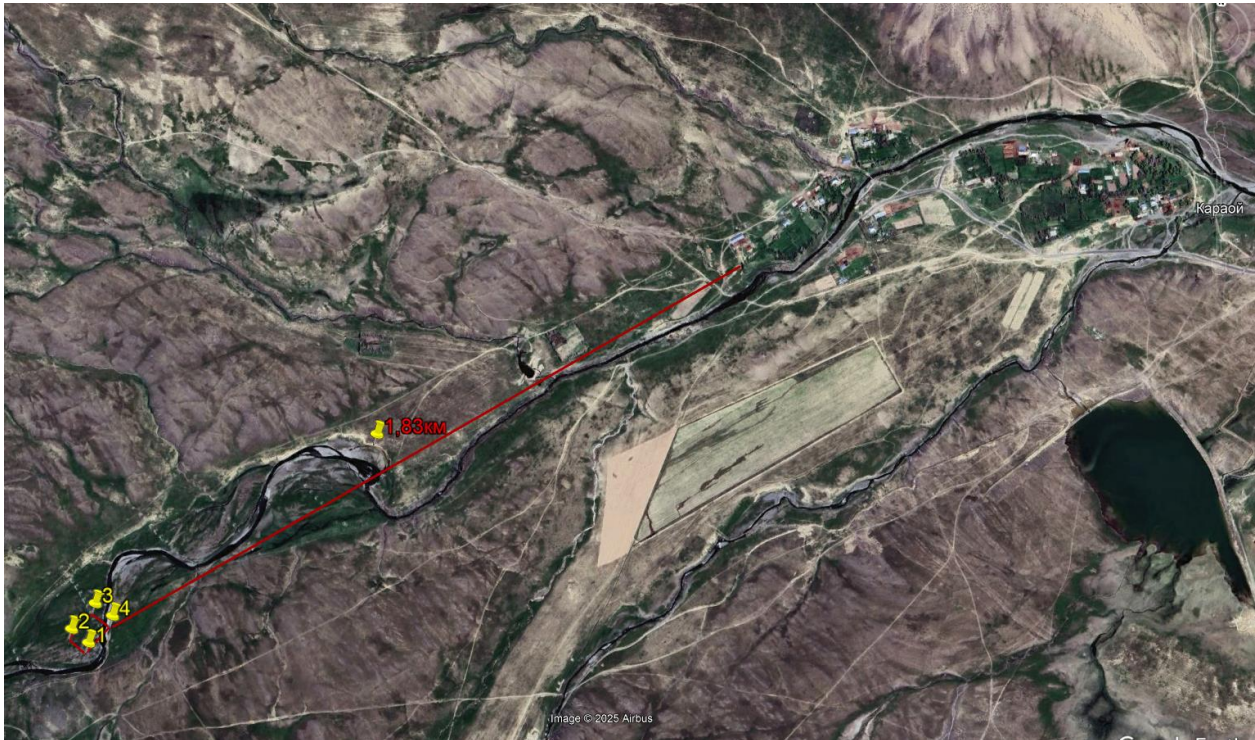
Рис.1 Ситуационное расположение объекта