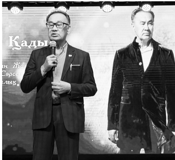
«Отпан-тау» тарихи-мәдени ескерткішіне қатысты идеологиялық жұмыстарға атсалысты. Сонымен қатар аудан, облыс көлеміндегі көптеген тарихи-мәдени жобалардың жү-