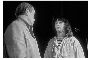
2 «Женская собственность» (18+)