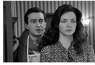
4 «Ирония судьбы. Продолжение» (12+)