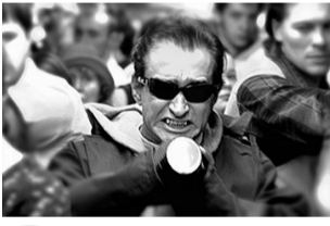
3 «Ночной дозор» (18+)