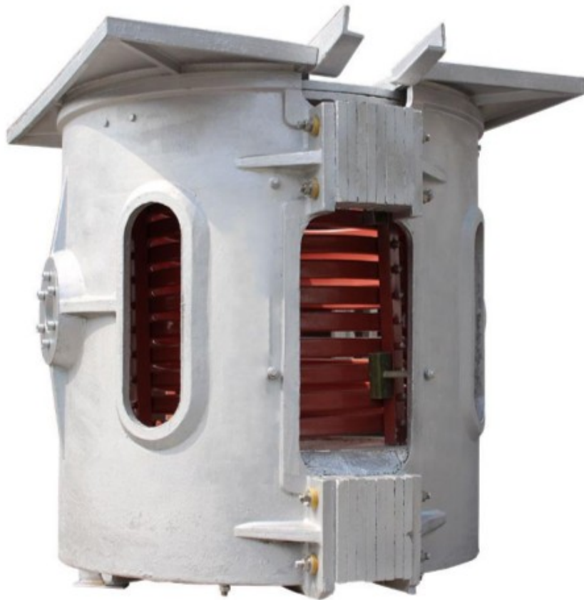
Рис.2. Индукционная плавильная печь.