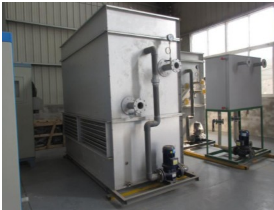
Рис.3. Закрытая система охлаждения.