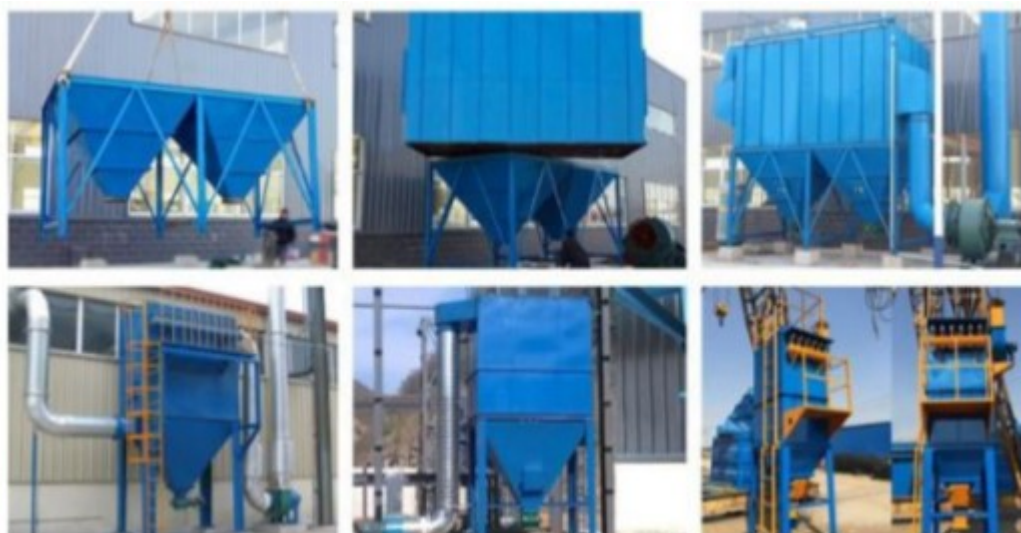
Рис.5. Аспирационная система очистки.