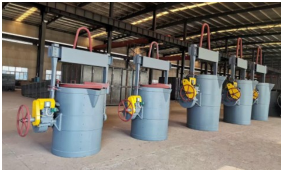
Рис.4. Литейный ковш.