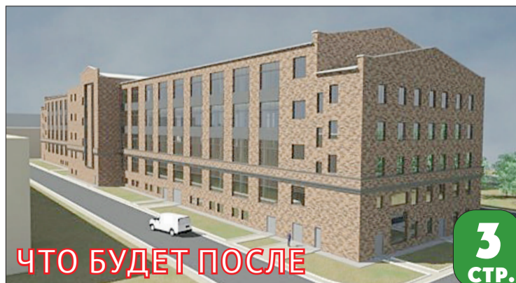
ЧТО БУДЕТ ПОСЛЕ