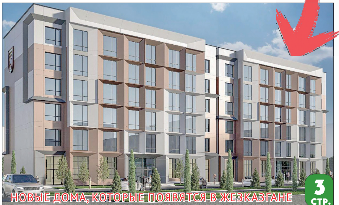
НОВЫЕ ДОМА, КОТОРЫЕ ПОЯВЯТСЯ В ЖЕЗКАЗГАНЕ