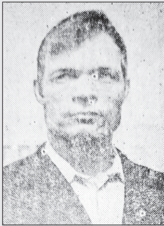
Газета «Целинная новь» 1981г.