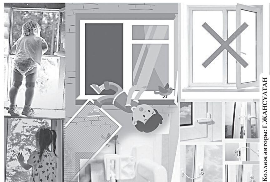
Коллаж авторы: Г. ЖАНСУЛТАН

Жарнама қабылдау телефондары: 3 07 66, 8 778 482 17 55