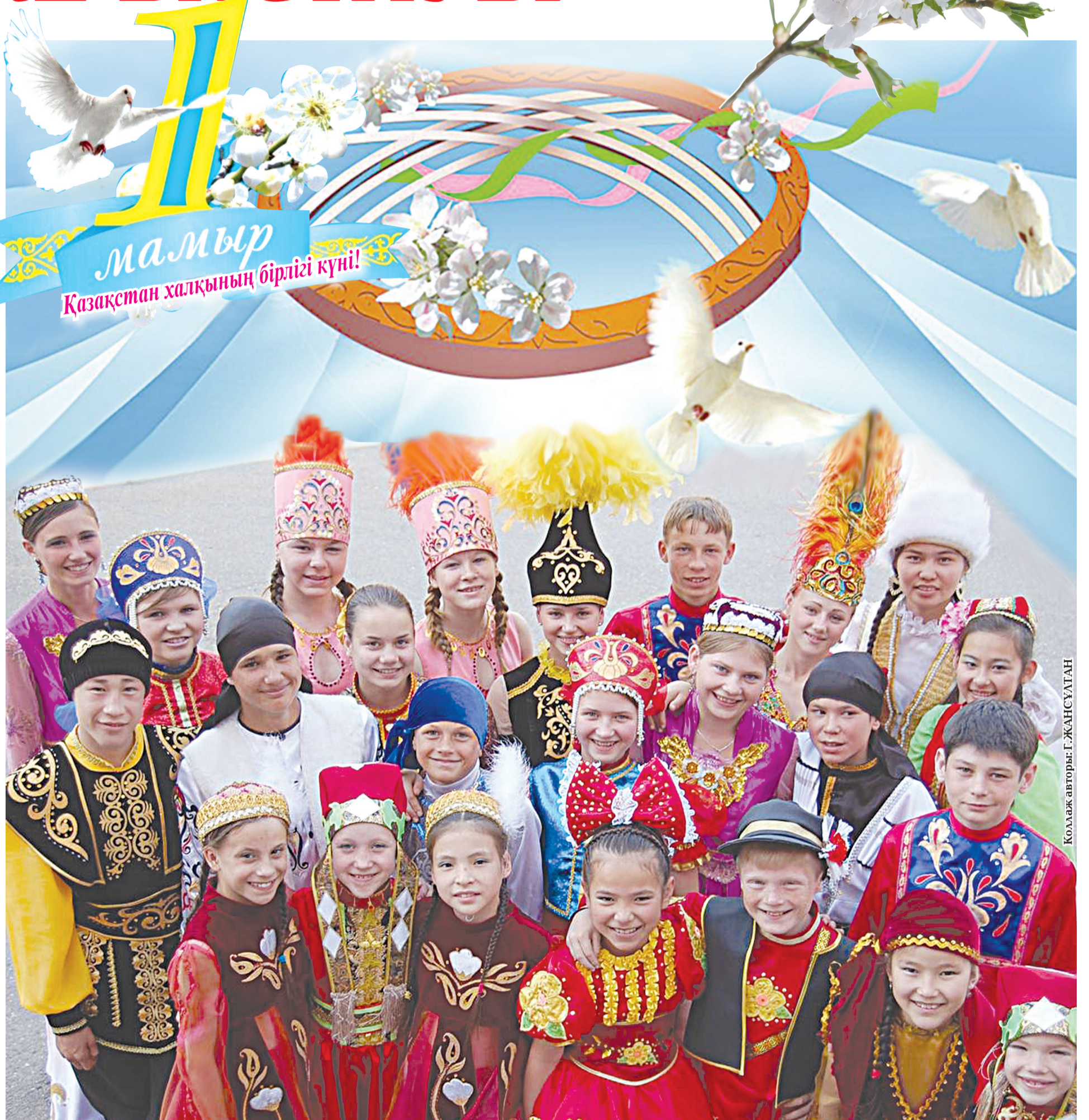
Коллаж авторы: Г. ЖАНСУЛТАН