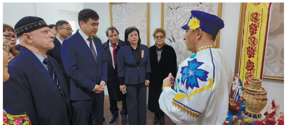
тын басылымдар көпшілікке ұсынылды. Кеш барысында аудан әкімі Әлия

Мерекелік іс-шара аудандық мәдени-демалыс орталығында жалғасын тапты. Мұнда «Бірлігі жарасқан туған ел» атты кітап көрмесі ұйымдастырылып, түрлі этнос өкілдерінің тарихы мен мәдениетін таныта-