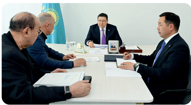
что ни одно из поднятых обращений не останется без внимания и будет находиться на его личном контроле.

Глава региона выслушал обращения граждан, разъяснил пути решения проблемных вопросов в рамках законодательства и дал конкретные поручения руководителям соответствующих управлений и акиму города. Он отметил,