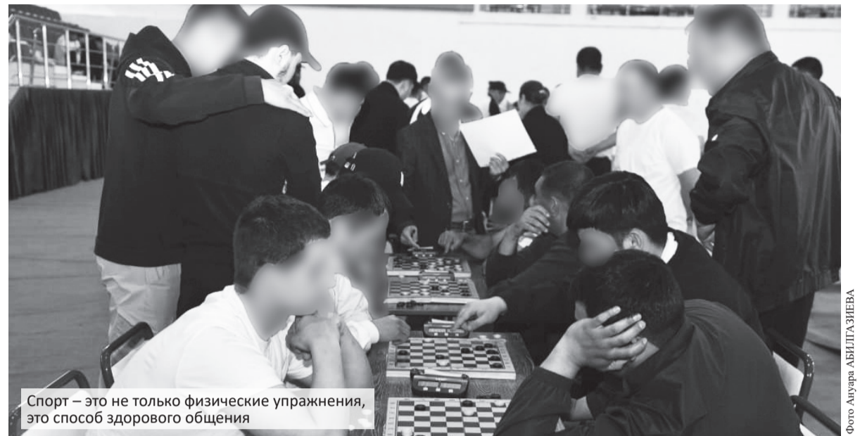
Спорт – это не только физические упражнения, это способ здорового общения

В честь празднования Дня защитника Отечества прокуратура города Атырау в рамках реализации проекта «Закон и порядок» организовала спортивные соревнования среди граждан, состоящих на учете службы пробации. Мероприятие прошло в спортивном комплексе «Жайык» Атырауского университета имени Х. Досмухамедова.