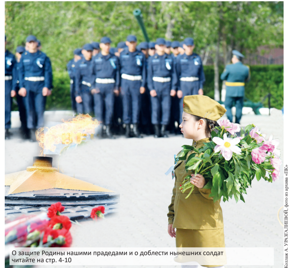
О защите Родины нашими прадедами и о долбести нынешних солдат читайте на стр. 4-10

Коллаж А. УРЪЛЗАЛШЕВ