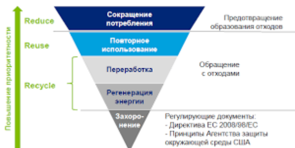
Рис. 4.3.1 – Иерархия с обращениями отходами.

При применении принципа иерархии должны быть приняты во внимание принцип предосторожности и принцип устойчивого развития, технические возможности и экономическая целесообразность, а также общий уровень воздействия на окружающую среду, здоровье людей и социально-экономическое развитие страны.