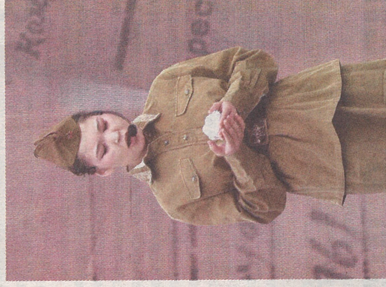
Глубину представлению придало то, что

героизм фронтовиков на передовой, самоотверженный и изнурительный труд работников тыла, а также трагические судьбы матерей, проводивших сыновей в неизвестность войны. Постановки позволили наглядно показать стойкость народа в годы тяжелых испытаний.