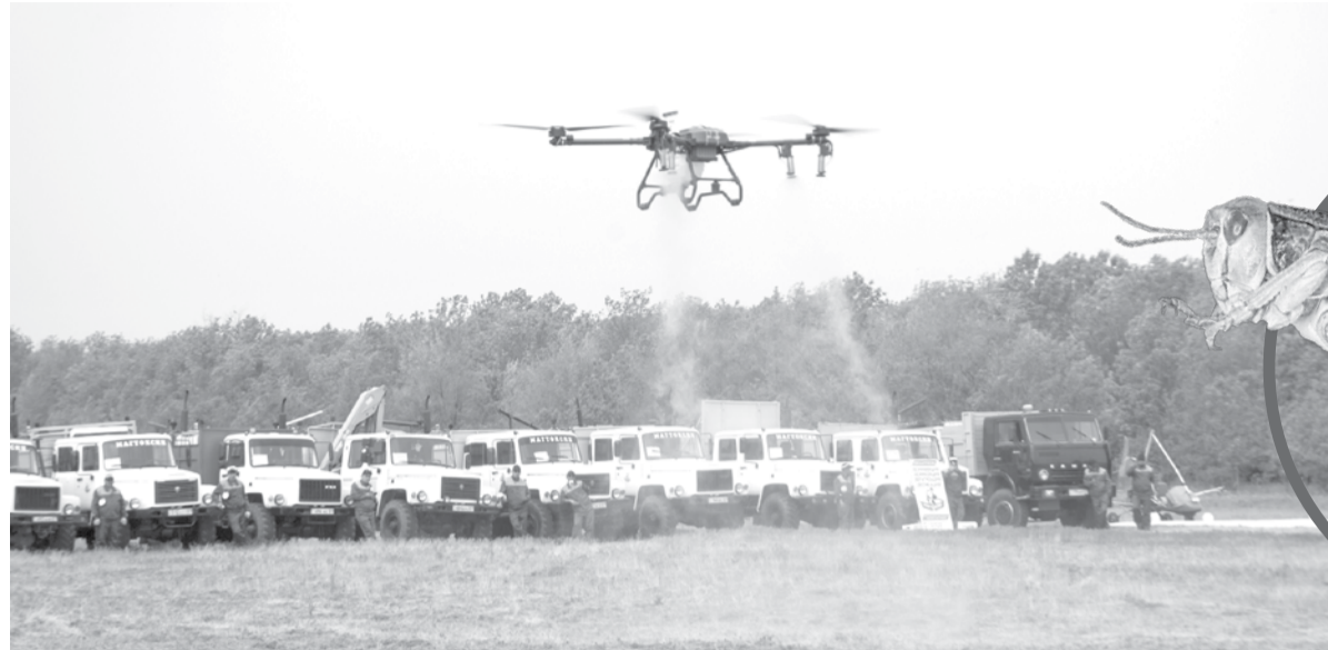
ве привлекут 32 обследователя, – сообщил он.

По словам заместителя акима, распространение саранчи во многом зависит от погодных условий. Если в 2024 году в области обработали 209 тыс. га, то в прошлом году объем вырос до 540 тыс. га. В нынешнем сезоне площадь обработки уменьшена до 455 тыс. га. Специалисты связывают это с результативностью своевременно проведенных работ.