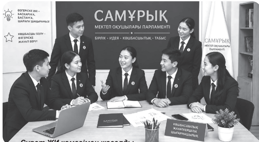
Сурет ЖИ көмегімен жасалды

Парламент құрамындағы оқушылар мектепшілік шаралармен ғана шектелмей, аудандық және облыстық деңгейдегі байқауларға да қатысып, жоғары нәтижелерге қол жеткізіп келеді. Оқушылардың «Адалдық – адамдық белгісі» атты облыстық байқауда жүлделі орын-дарға ие болуы адалдық, адамгершілік сынды асыл қасиеттерді бойларына жинаған тәрбиелі ұрпақ қалыптасып келе жатқанын көрсетті. Ал «Адал ұрпақ» еріктілер клубының мүшелері аудандық кезеңде үздік атанып, облыстық байқауда II орын иеленді. Бұл – оқушылардың