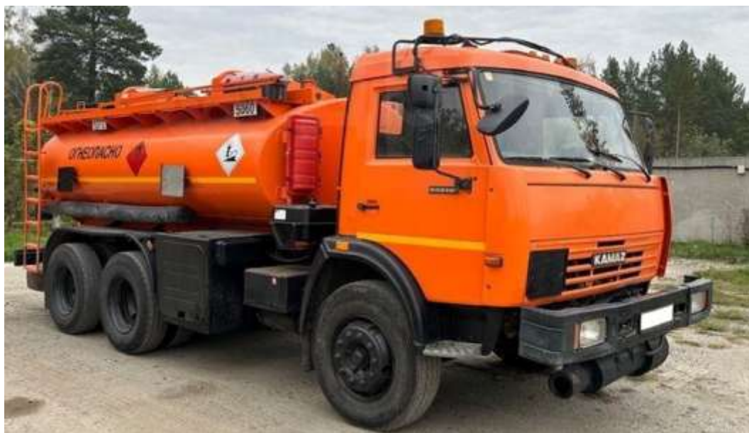
Топливозаправщик КАМАЗ 53215