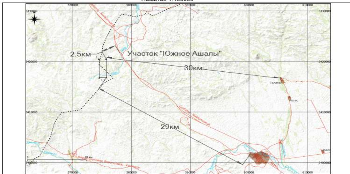
Ситуационная карта-схема расположения участка "Южное Ашалы" масштаб 1:150000

Санитарно-профилактические учреждения, зоны отдыха, медицинские учреждения и охраняемые законом объекты (территории заповедников, музеев, памятники архитектуры и др.) в районе размещения площади лицензии №3923-EL отсутствуют.