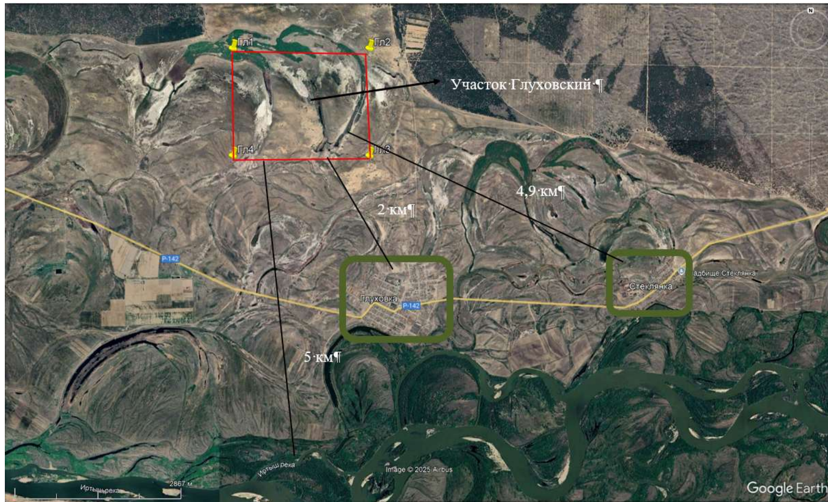
Рисунок 0.1 – Карта-схема расположения Глуховского месторождения относительно жилых массивов с нанесением водного объекта (река Иртыш)

Программа производственного экологического контроля «Плану горных работ на Глуховском месторождении песка, расположенном в Бескарагайском районе, область Абай»