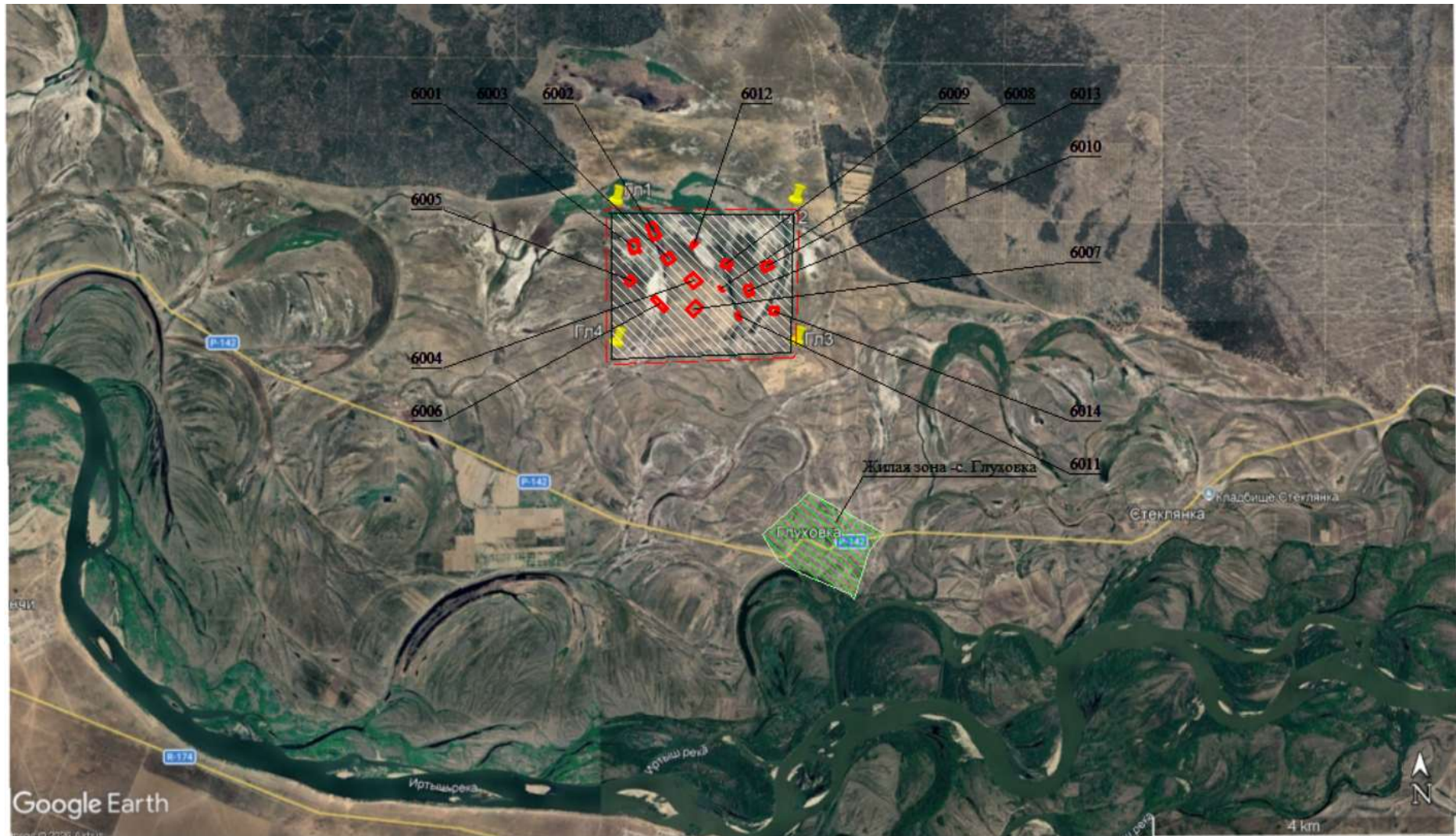
Рисунок 0.2 – Карта-схема района расположения Глуховского месторождения песка с указанием границ санитарно-защитной зоны, источников выбросов и жилой зоны

Программа производственного экологического контроля «Плану горных работ на Глуховском месторождении песка, расположенном в Бескарагайском районе, область Абай»