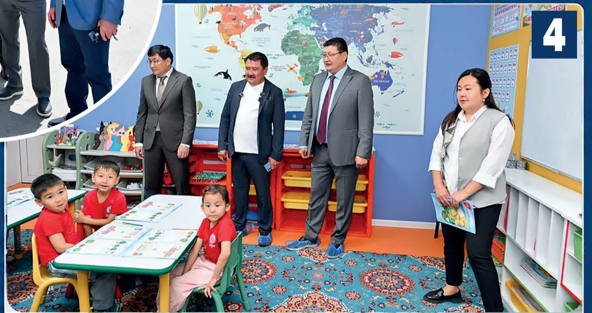
4 Облыс әкімі Семейдегі «Zhuldyz-Ardak» балабақшасының жұмысымен танысты

Абай облысында жаңа жобаларды жүзеге асыруға, халықаралық ынтымақтастықты кеңейтуге және халықтың әл-ауқатын арттыруға бағытталған жұмыстар жүйелі жалғасуда. Аймақ басшысы Берік Уәлидің қатысуымен өткен кездесулер мен жұмыс сапарлары облыстың даму қарқыны артып келе жатқанын аңғартады.