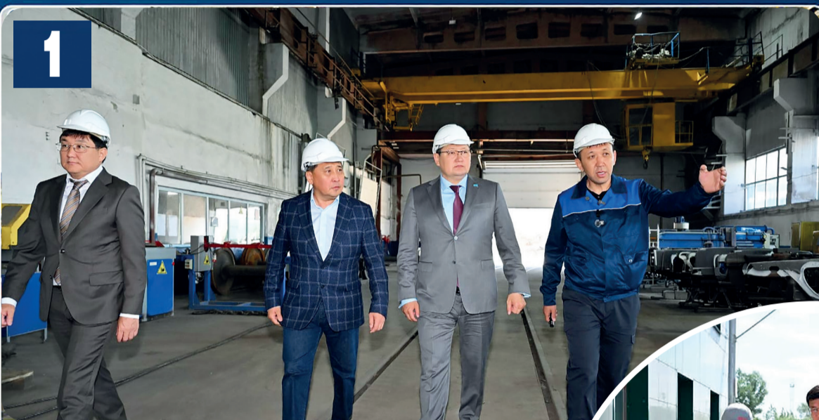
1 Облыс әкімі Семейдегі кәсіпорындарды аралады