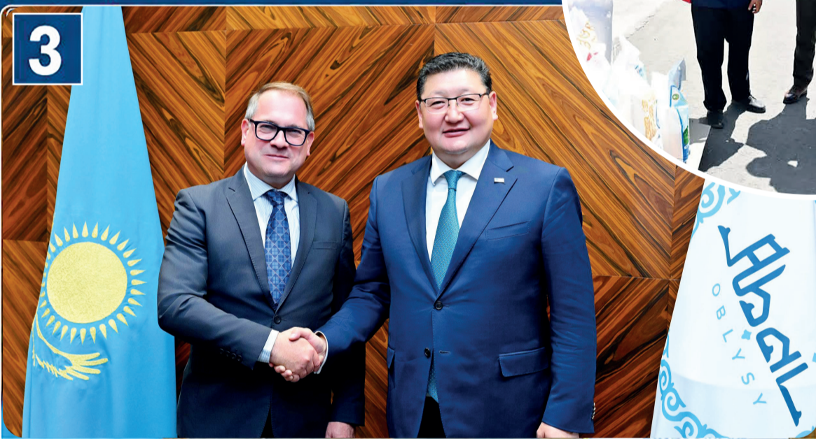
3 Францияның Қазақстандағы елшісі Абай елінде