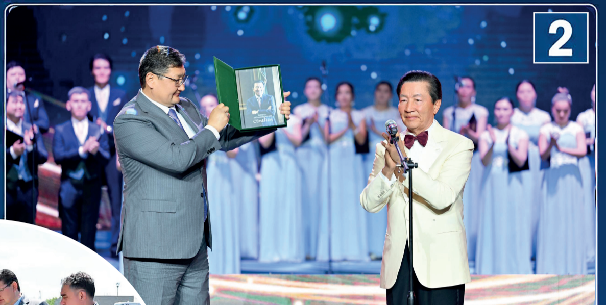
2 Композитор Төлеген Мұхамеджанов туған жерінде