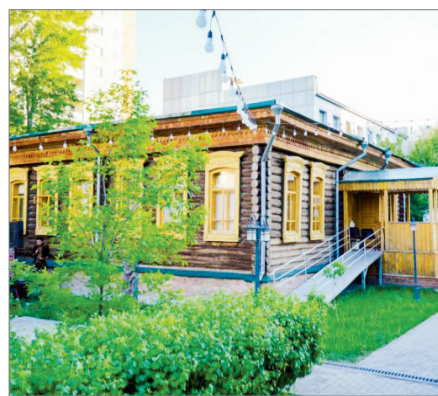
АШЫҚ АСПАН АСТЫНДАҒЫ МУЗЕЙ