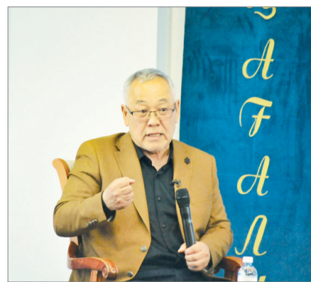
ҰЛТТЫҚ БОЛМЫС ЖӘНЕ ӘДЕБИЕТ