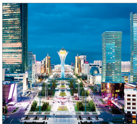
МӘДЕНИ ОРДАҒА АЙНАЛДЫ