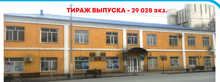
ТИРАЖ ВЫПУСКА - 29 028 экз.

Газета перерегистрирована в Министерстве информации и общественного развития Республики Казахстан Комитет информации 05 июня 2025 года. Регистрационное свидетельство № КЗ76VPY00121172 Газета набрана и сверстана в компьютерном центре ТОО «АВАИ АИМАК MEDIA». Отпечатана в ТОО «Печатное издательство агентство «Рекламный дайджест»: г. Усть-Каменогорск, пр. Абая, 20. Объем 4 у.л.п. Периодичность - два раза в неделю. За достоверность официальной информации, рекламы и объявлений редакция ответственности не несет. Рукописи не принимаются. Предоставленные материалы не рецензируются. Претензии по публикациям принимаются редакцией в течение месяца. Перепечатка и любое воспроизведение материалов и фотографий издания возможны только с письменного разрешения редакции.