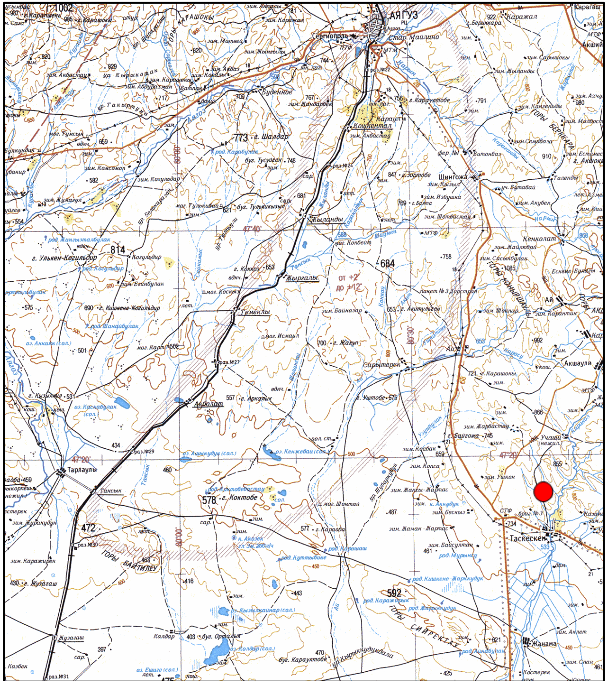
Обзорная карта расположения месторождения «Таскескен»