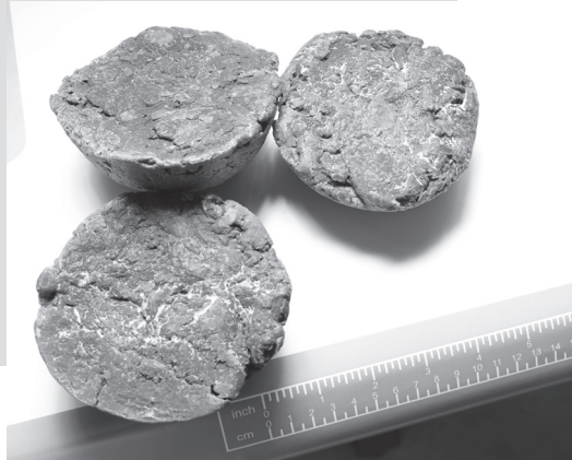
– Сабын жасауды анамнан үйрендім. Ол кісі маған бұл заттың қалай дайындалатынын көрсетті. Оны

Сауда нүктесінде ұлттық нақышта тігілген бас киім мен қазақы камзол сияқты түрлі бұйым сатылады. Оның бәрін өзі тігеді. Ерекше көзге түскені қара сабын. Кәсіпкердің айтуынша, ол да қолдан жасалған. Дүкен сөрелерінен басқа да заттарды табуға болады.