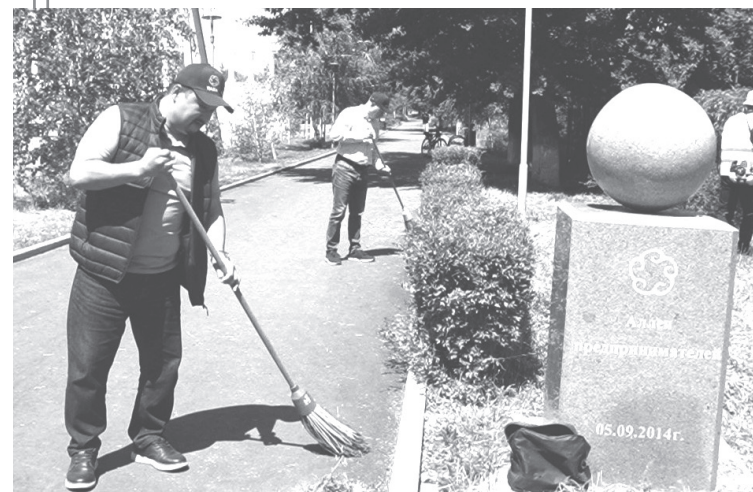
→ Сарқан ауданы